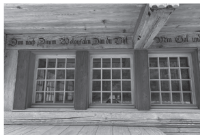
umbau haus in trueb

flükiger architektur gmbh tel 034 402 78 70