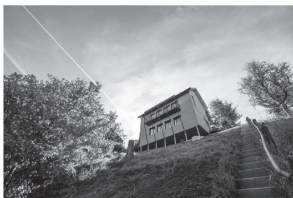
tiny haus in oberburg