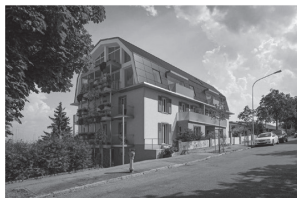
umbau bellevuestrasse spiegel bei bern